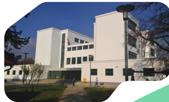
OŠ Jordanovac, Zagreb Područna razredna odjeljenja KBC Zagreb - Rebro